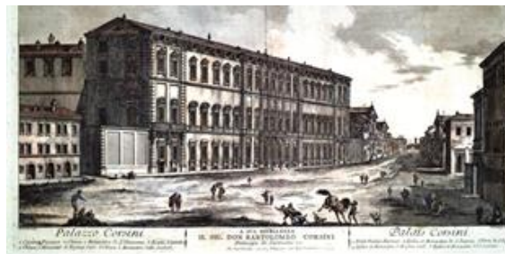
PALAZZO CORSINI in una incisione di J. Barbault (1763)