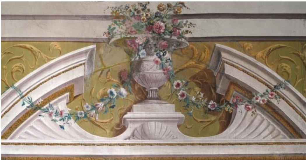
Taddéo Kuntze, Roma Palazzo Corsini