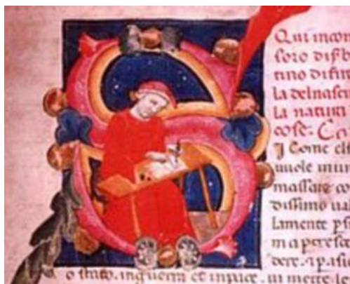
L'ACCADEMIA E DANTE La biblioteca di Dante