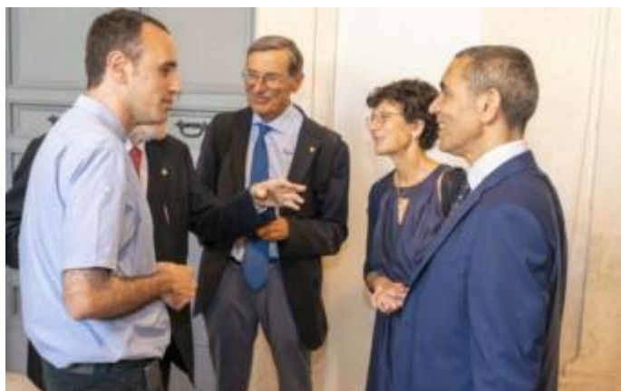
Incontro tra i premiati Feltrinelli