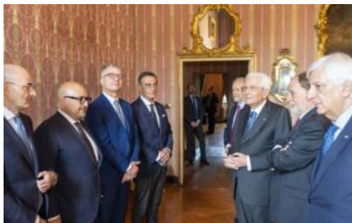
Saluti istituzionali prima della Cerimonia