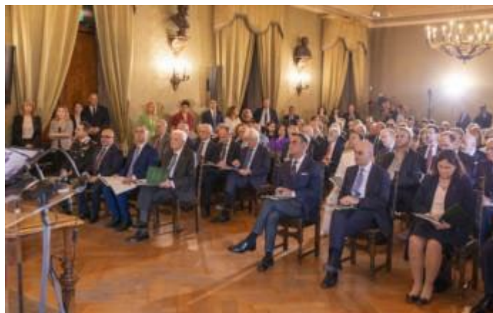
Sala di Scienze Fisiche