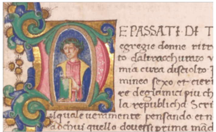
BANLC, 44 D 13, c. 4 r