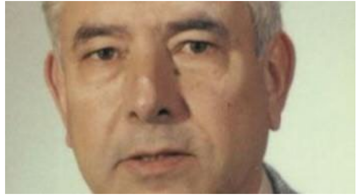
Immagine: il Socio Ennio De Giorgi che ottenne risultati pionieristici su molti temi di regolarità e spazi funzionali @Archivio storico Accademia Nazionale dei Lincei.