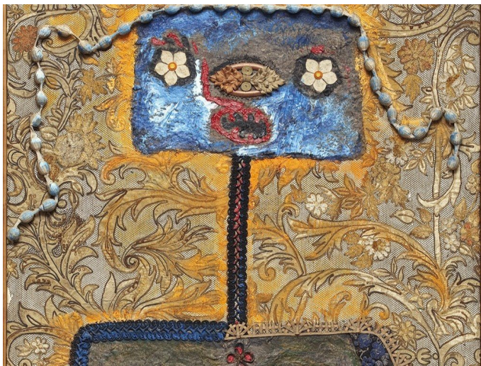
(Particolare) Enrico Baj, Berenice, 1960, olio e collage su tela, cm 92x73