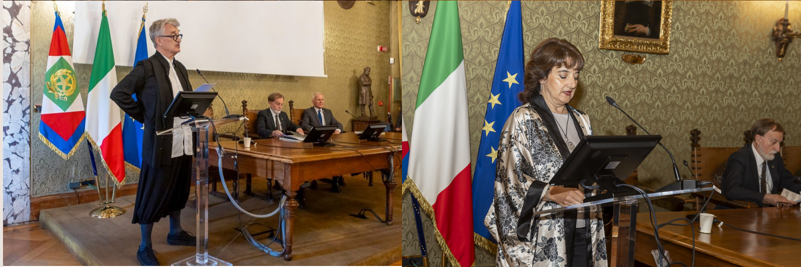
Video della Cerimonia