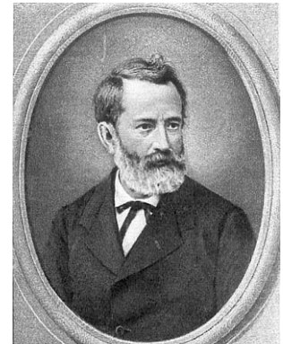
Quintino Sella (1827 - 1884) Presidente dal 1874 al 1884 della Reale Accademia dei Lincei

Siamo sicuri che quando questa raccolta triennale sarà pronta e commentata, risulterà rinnovata, pur dal nostro punto di vista di umanisti, quella funzione insostituibile delle scienze morali per dare un senso di direzione e significato ad un sapere scientifico completo. Quello che fu guida anche al nostro rifondatore e Presidente: Quintino Sella. Un personalità che tanto ha dato ai Lincei ed anche all'Unità d'Italia.