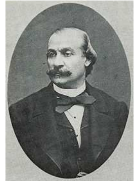
Terenzio Mamiani Della Rovere (1799-1885) Presidente della Classe e Vice Presidente dell'Accademia dal 1874 al 1884