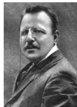
Benedetto Croce (1866-1952) Socio dal 1923 al 1952 e Presidente del Comitato per la ricostituzione dell'Accademia dei Lincei nel 1945-46