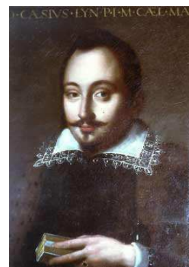
Federico Cesi Fondatore dei Lincei (1585–1630)

Per tenere fede alla nostra Accademia ed al suo fondatore, Federico Cesi, dobbiamo essere sempre consapevoli del nostro ruolo impegnandoci con iniziative culturali e scientifiche che arricchiscano il nostro sapere e dimostrino la rilevanza dei Lincei. Questo è ancor più importante nel momento storico presente che vede un affievolimento dei valori della cultura che nostri grandi fondatori e molti consoci hanno promosso affermando così l'Identità Italiana sia prima che dopo l'Unificazione Nazionale.