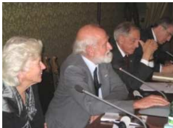
I coniugi Grant alla conferenza "Balzan Distinguished Lecture"