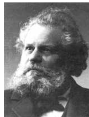
G. Carducci (1835-1907) Socio dal 1887 al 1907 Premio Nobel per la Letteratura nel 1906

Siamo consapevoli che le nostre segnalazioni spesso non trovano rispondenza nel conferimento del Premio, ma questo a nostro avviso non toglie nulla alla nostra convinzione di aver segnalato personalità scientifiche che largamente meritavano i premi e verso le quali l'Accademia Nazionale dei Lincei testimonia la massima stima.