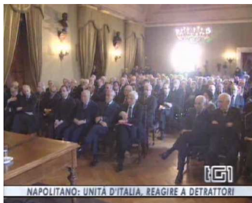
Una veduta della sala Lincea alla Conferenza del Presidente Giorgio Napolitano "Verso il 150° dell'Italia unita: tra riflessione storica e nuove ragioni di impegno condiviso"