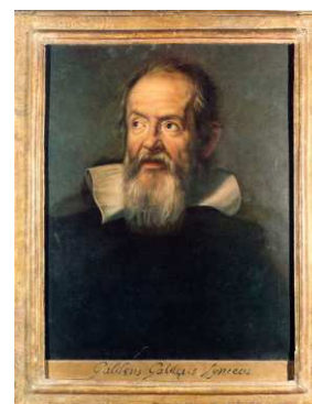
Galileo Galilei Socio Linceo dal 1611 (1564-1642)