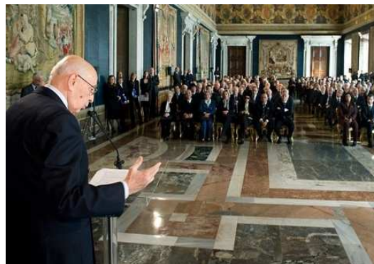
Giorgio Napolitano alla Cerimonia del Premio Nazionale del Presidente della Repubblica