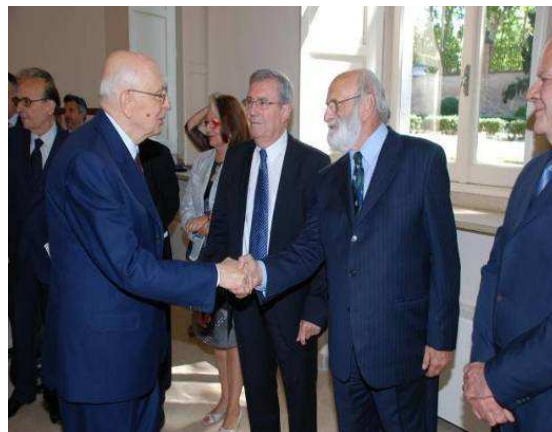
Il Presidente della Repubblica con alcuni premiati