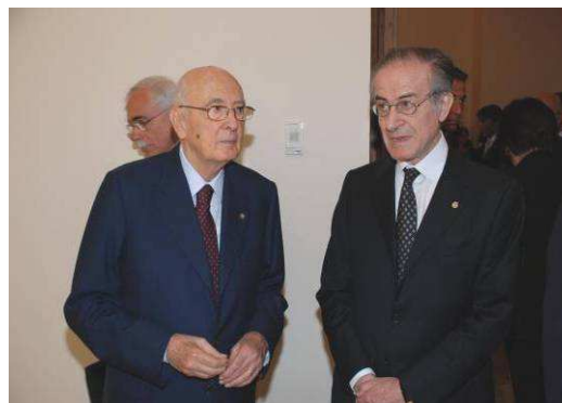
Il Presidente della Repubblica Giorgio Napolitano con Alberto Quadrio Curzio alla Cerimonia di Premiazione 2010

La Commissione, composta dai Proff. Fabrizio Sergio Donadoni (Presidente), Antonio Giuliano, Adriano La Regina, Paola Pelagatti, Salvatore Settis, Paolo