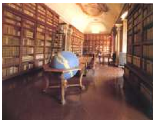
La Biblioteca dell'Accademia Nazionale dei Lincei e Corsiniana

Che una padronanza medio-alta dell'italiano sia un bene per il paese e il suo sviluppo culturale ed economico è di per sé evidente e non richiede particolari dimostrazioni. Per padronanza medio-alta si intendono gli usi scritti della lingua ma anche gli usi orali: non quelli della lingua quotidiana, che si apprendono spontaneamente in famiglia e nella società, in ambito cioè prevalentemente extrascolastico, ma gli usi professionali e più generalmente formali che si richiedono nelle varie forme comunicative della società contemporanea, nelle riunioni di lavoro come nei discorsi o discussioni pubbliche, e nelle modalità diverse oggi consuete, da quella faccia a faccia ai modi tecnologicamente evoluti, fino alla teleconferenza e simili.