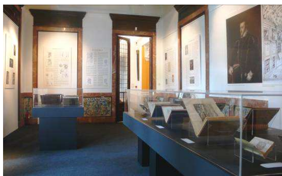
Mostra El Tesoro mexicano. La Accademia dei Lincei y las maravillas naturales del Nuevo Mundo